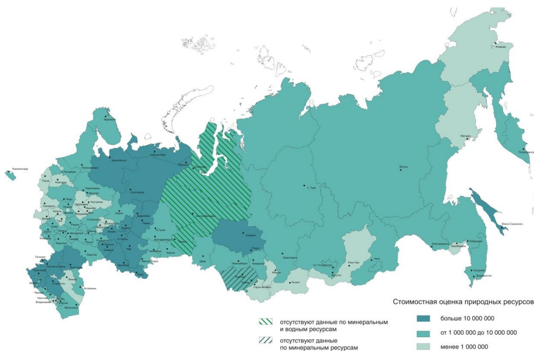
Рис. 2. Стоимостная оценка природных ресурсов субъектов РФ (тыс. рублей) (По данным сбора информации специалистами территориальных органов Росстата в субъектах РФ на конец 2007 г.)