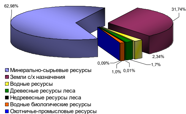
Рис. 1. Структура природного капитала Российской Федерации на конец 2007 г. (в процентах)

конец 2007 г. в сумме 599,4 млрд. рублей и их структуру (см. рис. 1). Наибольшую долю в их стоимости, по полученным расчетам, составляют минерально-сырьевые ресурсы (62,98%); существенно доля земельных ресурсов сельскохозяйственного назначения (31,74%). Водные ресурсы (в сумме поверхностных и подземных вод) составляют 2,34%; доля остальных природно-ресурсных групп еще менее значительна - от 1,7% - древесных ресурсов до 0,01% - недревесных ресурсов леса. Результаты оценки экономической ценности природного капитала в разрезе субъектов Российской Федерации (см. рис. 2-4) показали весьма неоднородную картину.